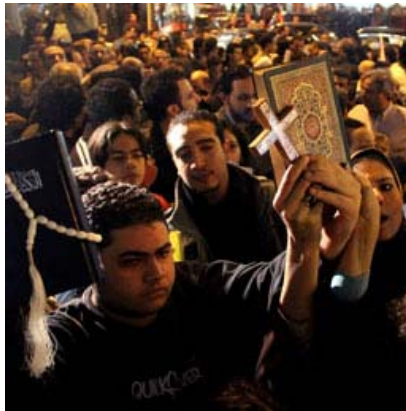
Cristiani Copti manifestano ad Alessandria d'Egitto

altri attacchi, anche a case private, suscitando paura nel-