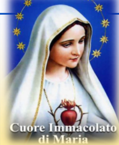
Cuore Immacolato di Maria

O Dio onnipotente ed eterno che preparasti nel Cuore della Beata Vergine Maria una degna dimora dello Spirito Santo, concedi propizio a noi che celebriamo devotamente la festa del suo Cuore Immacolato di vivere secondo il tuo cuore.